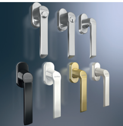
Kruk assortiment: standaard Gamme de poignées : standard